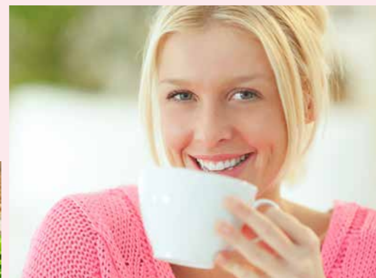
ČAJE STR. 22-26