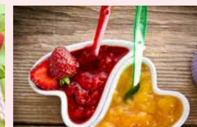
DŽEMY STR. 53