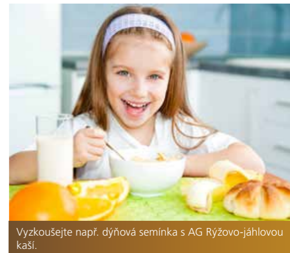
Vyzkoušejte např. dýňová semínka s AG Rýžovo-jáhlovou kaší.