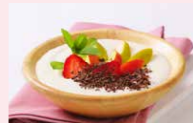
AG KAŠE STR. 44-45