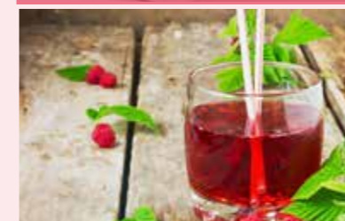
SIRUPY STR. 40-41