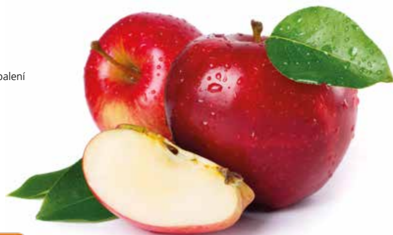
Jablko 120 g

- Platí u všech nabízených variant – ve 100 g hotového výrobku je obsaženo 95 g ovoce, které je možné umístit do spotřebního koše