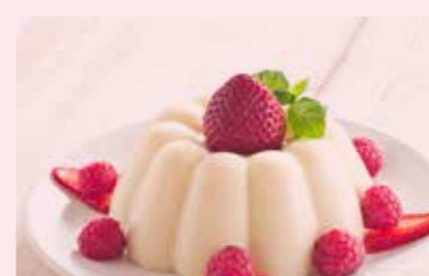
AG PUDING STR. 57