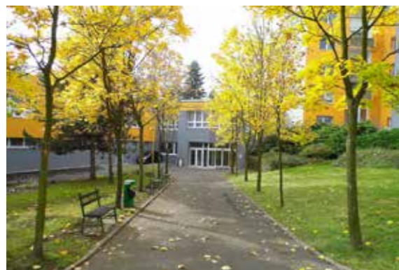
Domov pro seniory „U Dubu“

Celý rok 2016 bychom chtěli věnovat vzájemné spolupráci seniorů a dětí. V 1. pololetí pod názvem „Senioři dětem“ přiblížíme dětem jiný pohled na stáří a připravíme jim u příležitosti Mezinárodního dne dětí oslavu. Ve 2. pololetí nejen u příležitosti Mezinárodního dne seniorů, ale také Týdne sociálních služeb, bude pozornost věnována seniorům pod názvem „Děti seniorům“.