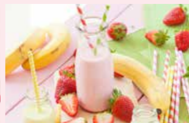
MILKY SHAKE STR. 32-33