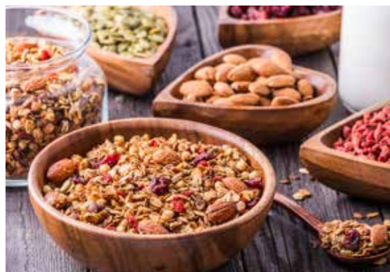
Semínka můžete přidat i do domácího müsli

Například sezamový olej je velice oblíbeným stolním olejem mnoha zemí s horkým klimatem, protože v teple nežlukne.