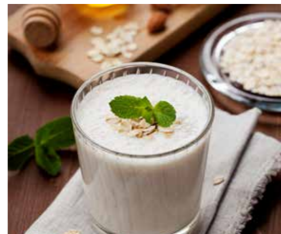
Domácí ořechové mléko si snadno vyrobíte sami.

Poté ořechy dobře propláchněte čistou vodou a rozprostřete na plech s pečícím papírem. Necháte je přirozeně vyschnout (minimálně den), nebo si pomůžete sušičkou či vložením do trouby na nejnižší teplotu (50 °C). Pokud byste ořechy nenechali řádně vyschnout, mohly by zplsnivět. Naprosto stejný postup použijte i při namáčení semen.