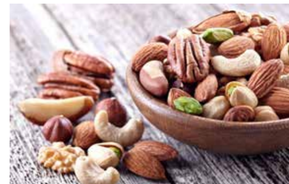
Živiny z máčených ořechů jsou pro tělo lépe dostupné.

Namočené ořechy ale nemusíte vůbec sušit, pokud je nechcete dále skladovat. Můžete je také hned sníst, nebo použít do nějakého receptu třeba na jáhlovou kaši nebo do pomazánky. Nebo vyzkoušejte domácí ořechové mléko. Jakmile se jednou napijete, už vám kupované nebude nikdy stačit. Ihned po namáčení zalijte 80 g ořechů 500 ml čerstvé vody. Důkladně rozmixujte výkonným mixérem. Přecedte přes gázu a vymačkejte, co nejvíc to jde. Získáte přibližně