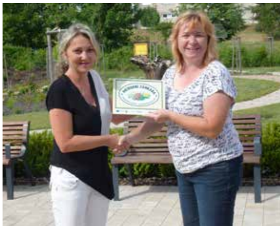
Ocenění Přírodní zahrada

To, že mnohdy musíme odmítat zájemce o naše služby, jelikož máme plně obsazeno a 550 žádostí o pobytové služby neumožní vyhovět všem. Osobně mě tíží velká administrativní zátěž, která se promítá do všech oblastí poskytovaných služeb. A co zlobí mé klienty? Odpovědi slyším každý den: „Zdraví, paní ředitelko“.