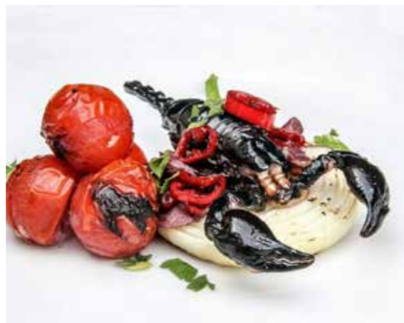
Uchutnali byste štíra?

Konzumaci hmyzu by se měl vyhnout jen ten, kdo má alergickou reakci na mořské plody. V tělech hmyzu je obsažena látka chitin, které u vnímavějších jedinců může vyvolat alergické reakce.