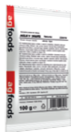
Milky Shake Naturea Jahoda