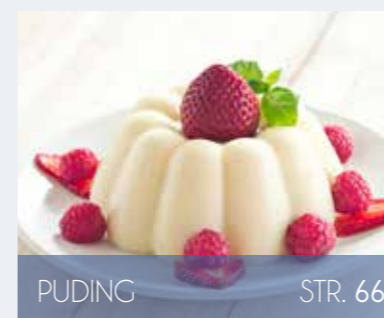
PUDING STR. 66