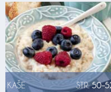
KAŠE STR. 50-52