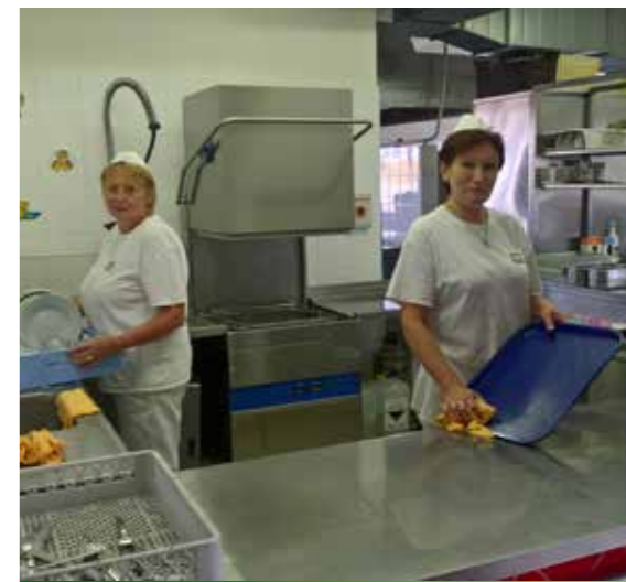
Vaříme vždy s úsměvem

Myslím, že můžeme být pyšní na naše domácí svačinky. Připravujeme je v rámci doplňkové činnosti.