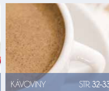
KÁVOVINY STR. 32-33