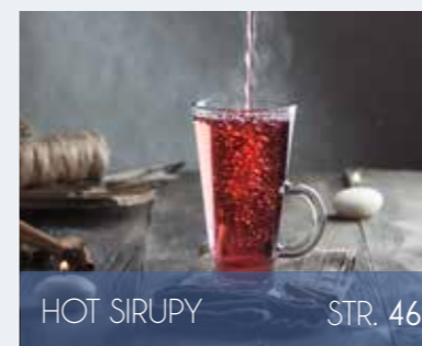
HOT SIRUPY STR. 46