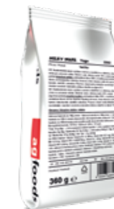
Milky Shake Yogo Vanilka