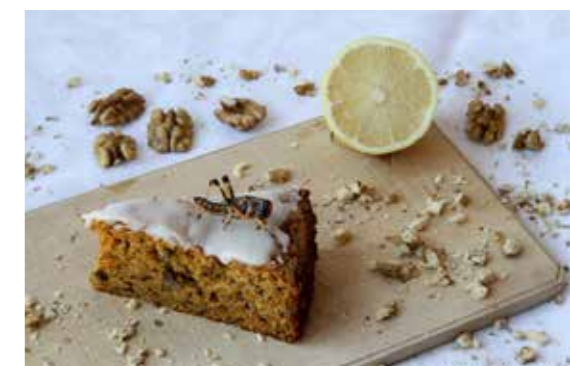
Hmyzí jídlo nemusí vždy být na slano

Víte, že 2,2 miliardy lidí na světě považuje hmyz za normální běžnou potravu? Nejméně 3000 etnických skupin konzumuje hmyz pravidelně, zejména brouky, larvy a kukly, cvrčky i luční kobylky. V jižní Africe představuje hmyz deset procent příjmu živočišných proteinů místních obyvatel. Příslušníci