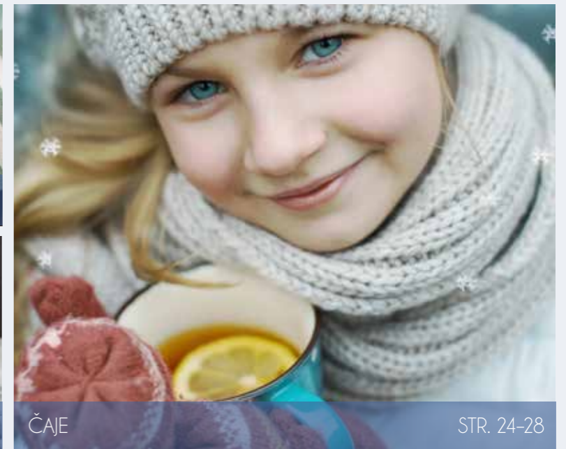
ČAJE STR. 24-28