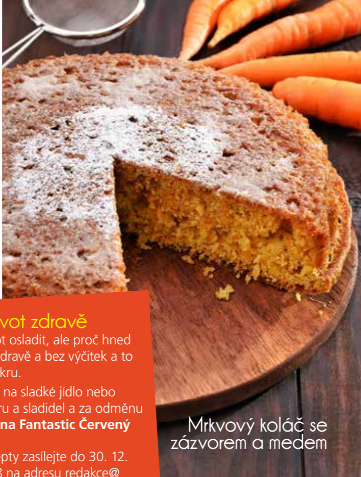
Mrkvový koláč se zázvorem a medem