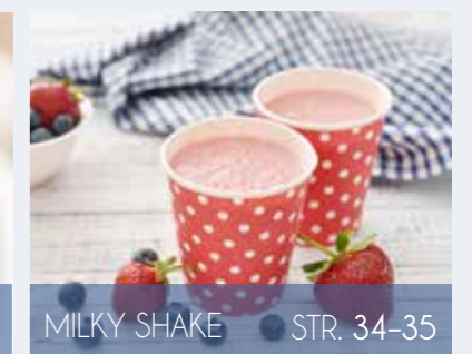
MILKY SHAKE STR. 34-35