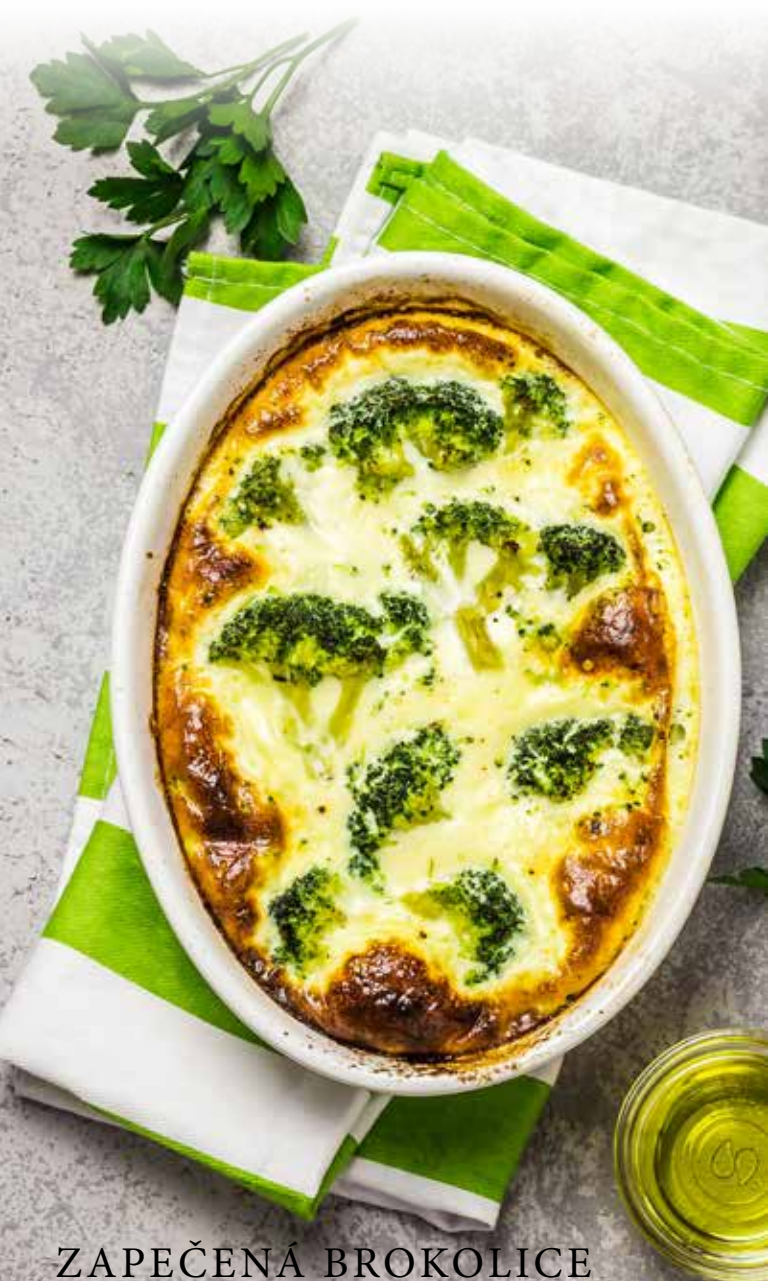
ZAPEČENÁ BROKOLICE SE SÝREM