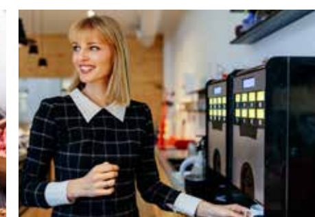
TECHNOLÓGIE STR. 66-67