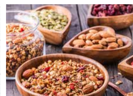
CEREÁLIE STR. 47