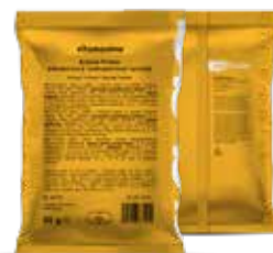
VITAMAXIMA N-DRINK PROTEIN S JEMNOU BANÁNOVOU PŘÍCHUTÍ VÁS ZASYTÍ I OSVĚŽÍ. VÍCE NA STR. 38

bývají poměrně časté zejména u imobilních seniorů, denně přijímat cca 1,5 g bílkovin na kilogram ideální tělesné hmotnosti. V praxi to znamená, že člověk vážící 70 kg by měl denně přijmout alespoň 105 g bílkovin, což by znamenalo sníst za celý den, mimo jiné, např. 100 g tvrdého sýra + 2 vejce + 100 g kuřecích prsou + 100 g polotučného tvarohu + 130 g lososa + 50 g vlašských ořechů. Naopak, nedostatečný příjem bílkovin způsobuje sníženou tvorbu kolagenu, který je nezbytný pro stavbu kvalitního a pevného vaziva, následkem čehož se prodlužuje doba hojení a dochází snadněji k infekčním komplikacím z důvodu oslabeného organismu. Není-li pacient s jakýmkoli vážnějším onemocněním schopen se uživit z běžně podávané stravy, je nutno zvolit speciální postupy. Preferujeme v prvé řadě obohacení jídelníčku formou přísadků v podobě přirozených potravin bohatých na bílkoviny, modulovými dietetiky a enterální výživou, tzv. sippingem. Z bílkovinných potravin vybíráme podle preference pacienta z nabídky sýrů, tvarohových dezertů, vajec, kvalitní šunky, libového masa, ryb, sušeného mléka apod.