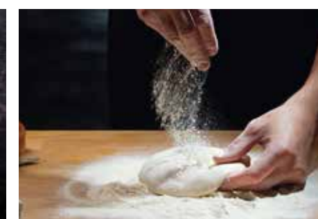
LUŠTĚNINOVÉ MOUKY STR. 64