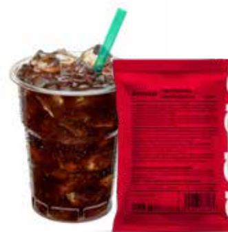
lahodná osvěžující chuť