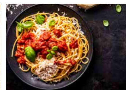
TĚSTOVINY A PŘÍLOHY STR. 62