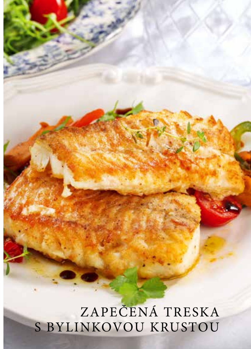
ZAPEČENÁ TRESKA S BYLINKOVOU KRUSTOU

Text: Alena Matušková, redakce AG FOODS