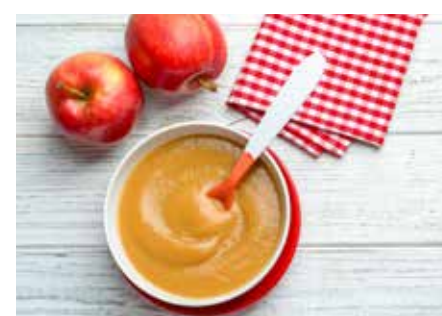
OVOCNÉ PYRÉ STR. 57-58