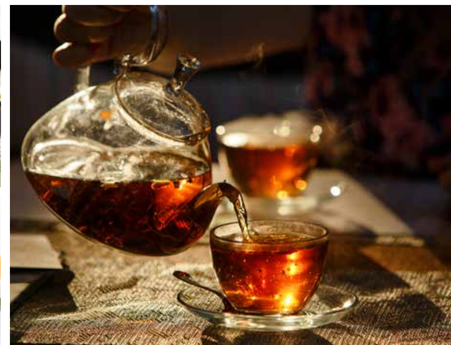
ČAJE STR. 28-33