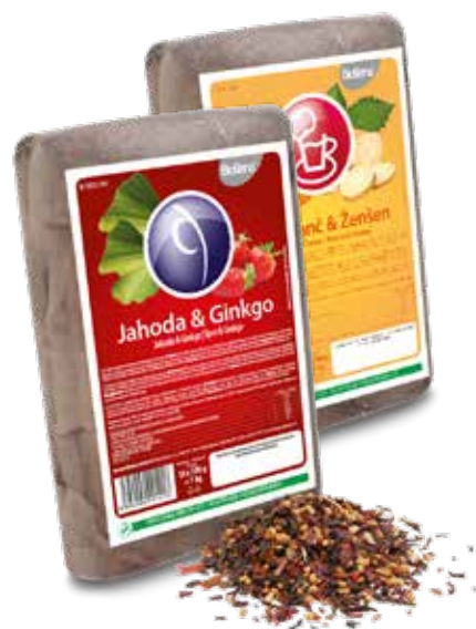
unikátní čajové směsi