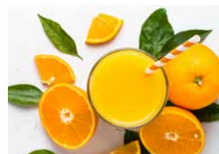
DŽUSY STR. 34