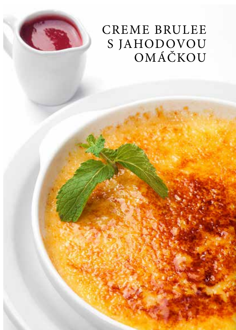
CREME BRULEE S JAHODOVOU OMÁČKOU