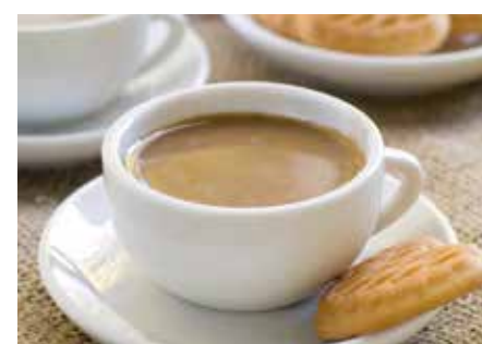
KÁVOVINY STR. 36-37