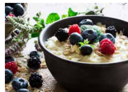
KAŠE STR. 48