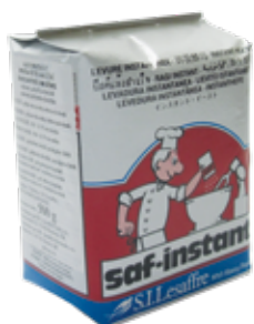
identické kynutí jako u čerstvého droždí