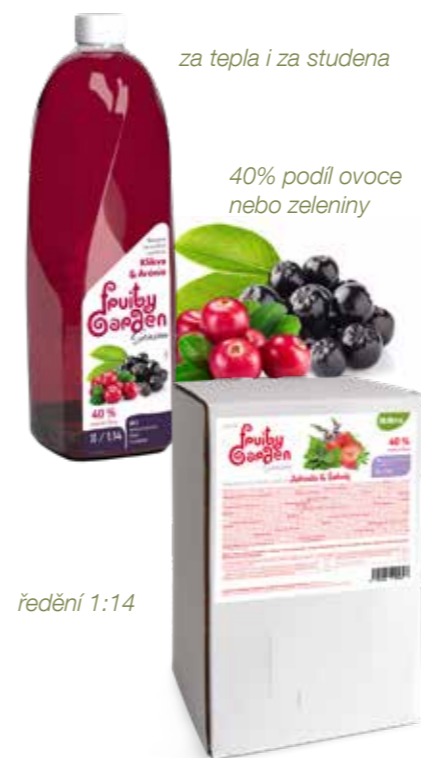
za tepla i za studena