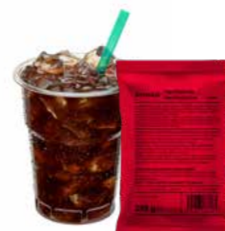
lahodná osvěžující chuť