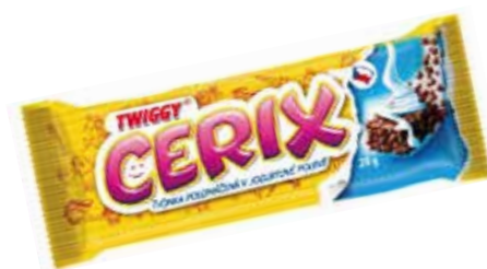
oblíbené u dětí