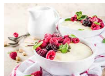
KAŠE STR. 52-53