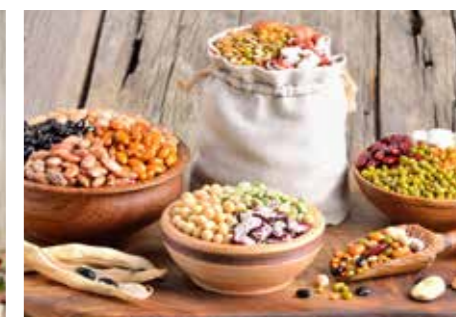
LUŠTĚNINY STR. 63