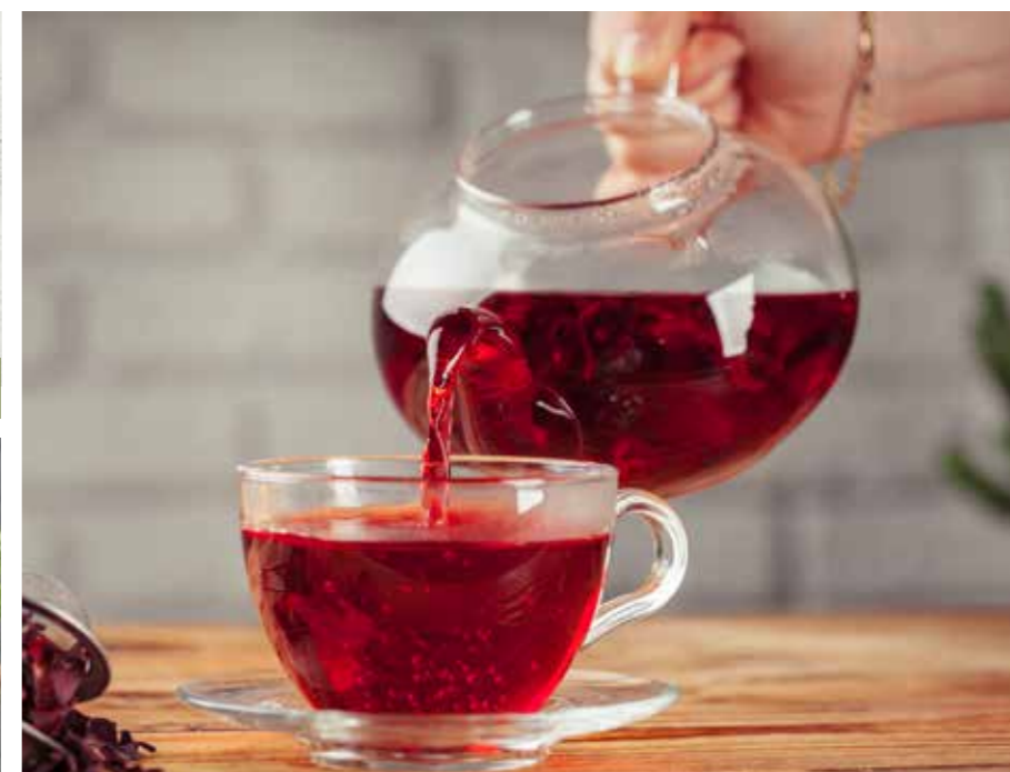
NÁLEVOVÉ ČAJE STR. 26-30