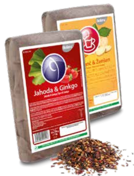
unikátní čajové směsi

Pečlivě sladěné kombinace ovoce a bylin v prémiových čajích. Celá tato řada je inspirována nejnovějšími trendy v čajovém světě. Všechny ovocné čaje obsahují minimálně 50 % ovoce.