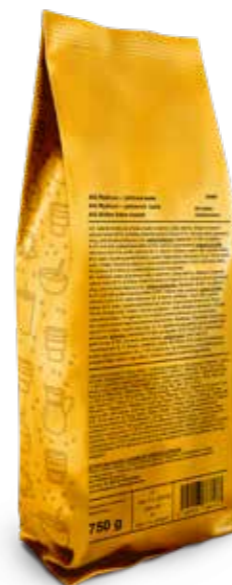
při dvojnásobném ředění vhodné na pití