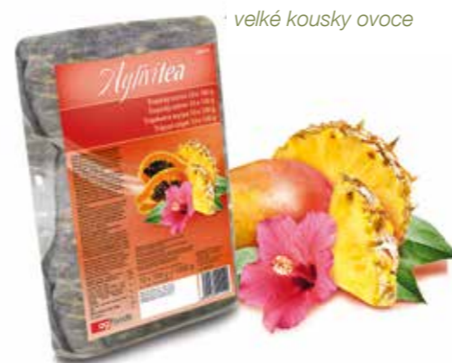
široký výběr příchutí