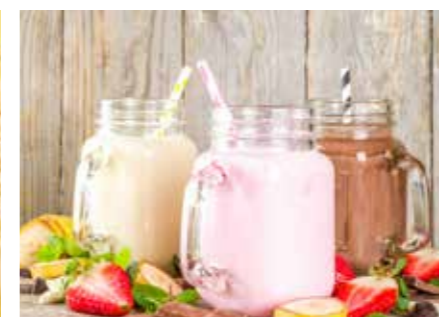
PŘÍCHUTĚ DO MLÉKA STR. 40