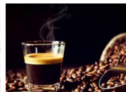
KÁVA STR. 39