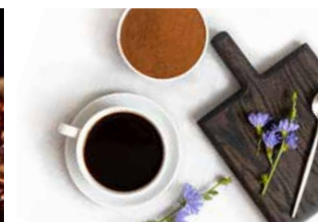
KÁVOVINY STR. 37-38