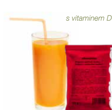
s vitaminem D