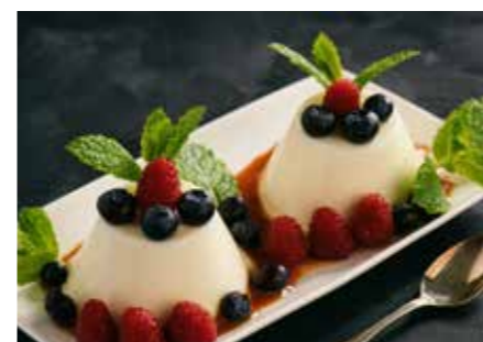
PUDING STR. 57