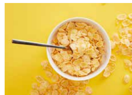
CEREÁLIE STR. 46