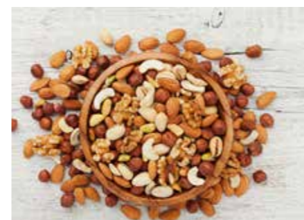
OŘÍŠKY STR. 64