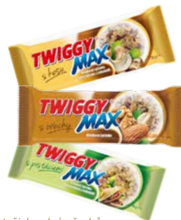
tyčinky plné ořechů